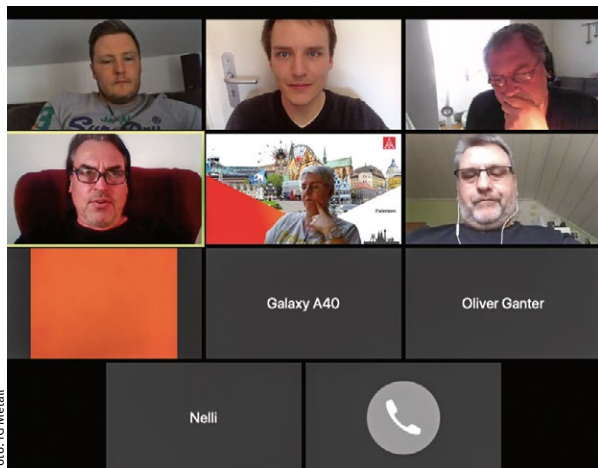
Unser Vertrauensleute-Ausschuss in digitaler Aktion

Unsere regulären Ortsjugend- und Vertrauensleutesitzungen können wir aktuell leider nicht durchführen. Damit unsere gewerkschaftliche Arbeit trotz aller Vorsichtsmaßnahmen nicht zum Erliegen kommt, satteln wir auf Online-Konferenzen um, wo wir es nur können. Für Vertrauensleute gibt es spezielle Webinare (siehe Termine). Auch im Ortsjugendausschuss setzen wir auf Videokonferenzen, um den Informationsfluss sicherzustellen. Themen sind zum Beispiel der Einfluss von Kurzarbeit auf die Ausbildung, die Verschiebung der Abschluss- und Zwischenprüfungen und digitale Bildungsangebote.